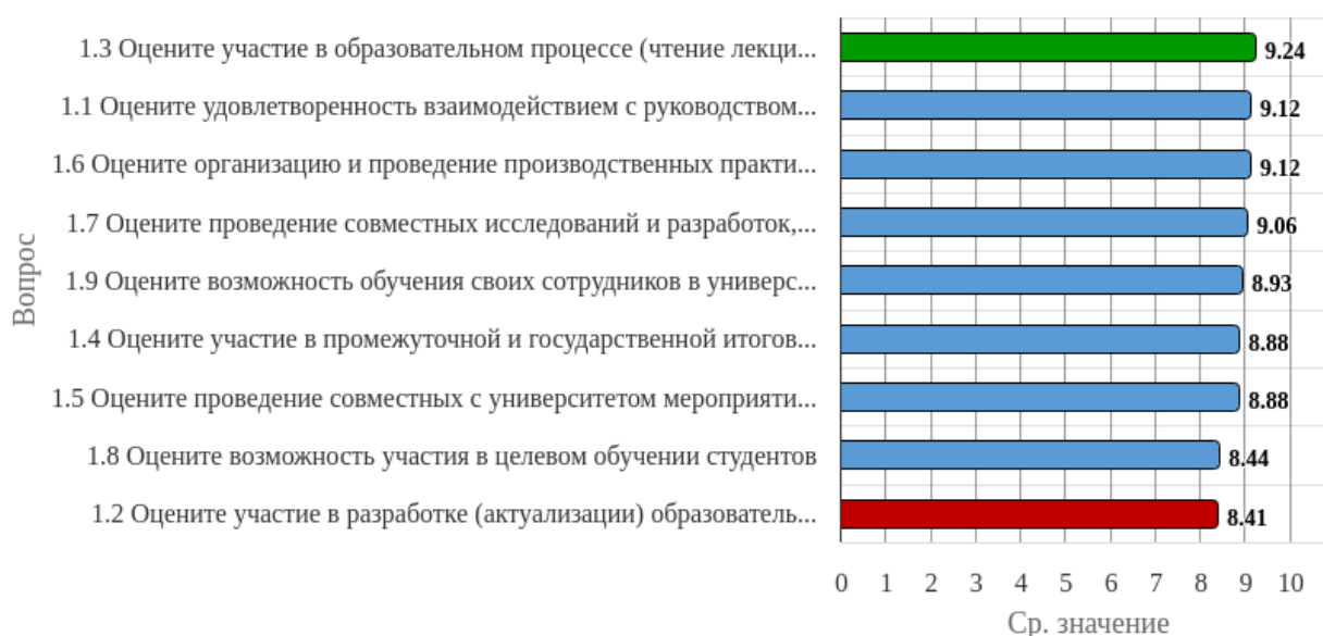
Рисунок 1.1 - Распределение показателей уровня удовлетворенности респондентов по блоку вопросов «Удовлетворенность взаимодействием с вузом»

Индекс удовлетворенности по блоку вопросов «Удовлетворенность взаимодействием с вузом» равен 8.9.